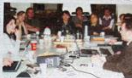
© 2006 Blackwell Publishing Ltd, Journal of Internal Medicine 260: 395–403

Phonetic: Shayda = 40 Shayda = 40 Shayda = 40